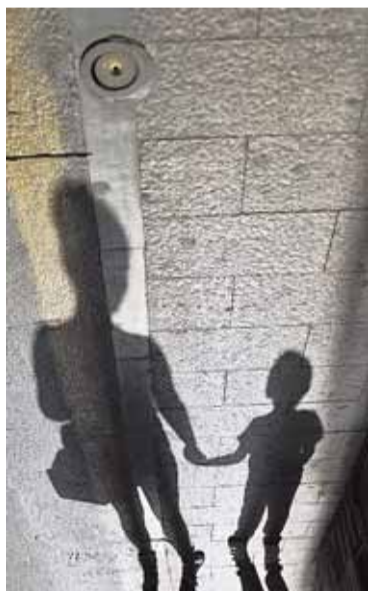
Imagen ganadora del V Maratón Fotográfico de Murcia.